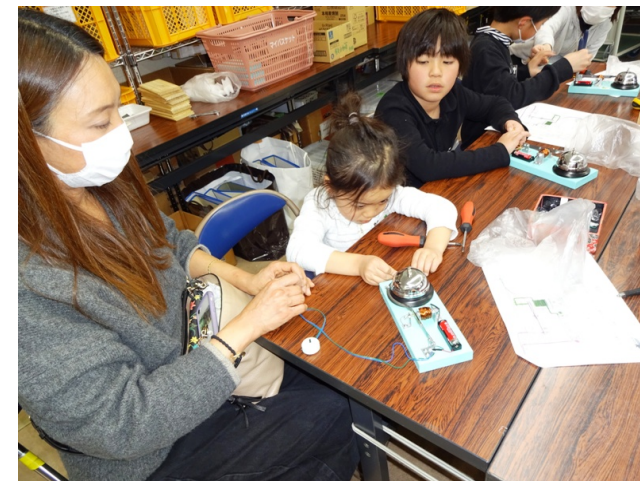
レバー等最終調整しベルが鳴る