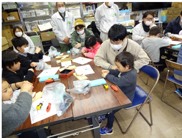
巻線しコイルづくり

電磁石を応用したベルづくり 巻線した電磁石をつくり、組立配線するとベルが鳴り歓声！！