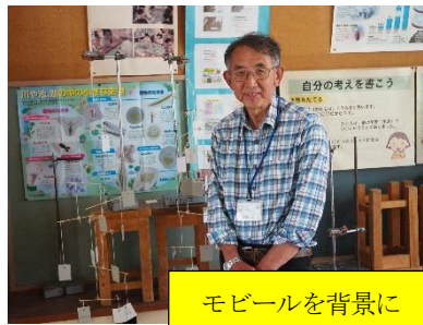
モバイルを背景に