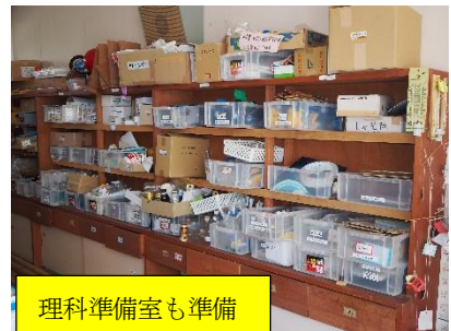
理科準備室も準備